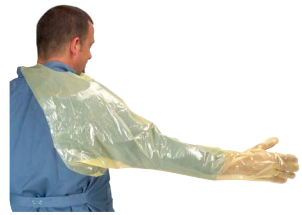
Krutex super touch