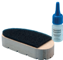
Demotec Futura klövsko