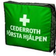
Första hjälpen-kudde, stor