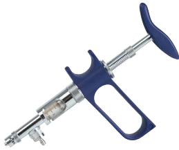
Socorex automatspruta 1 ml