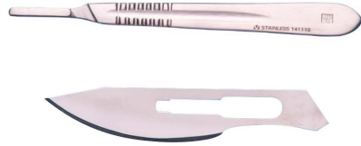
Kruuse skalpellhantag och -blad