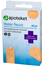
Apoteket plåster Water Resist