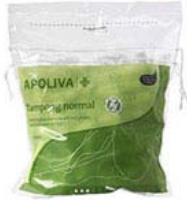
Apoteket tampong normal