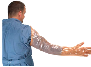
Krutex super sensitive